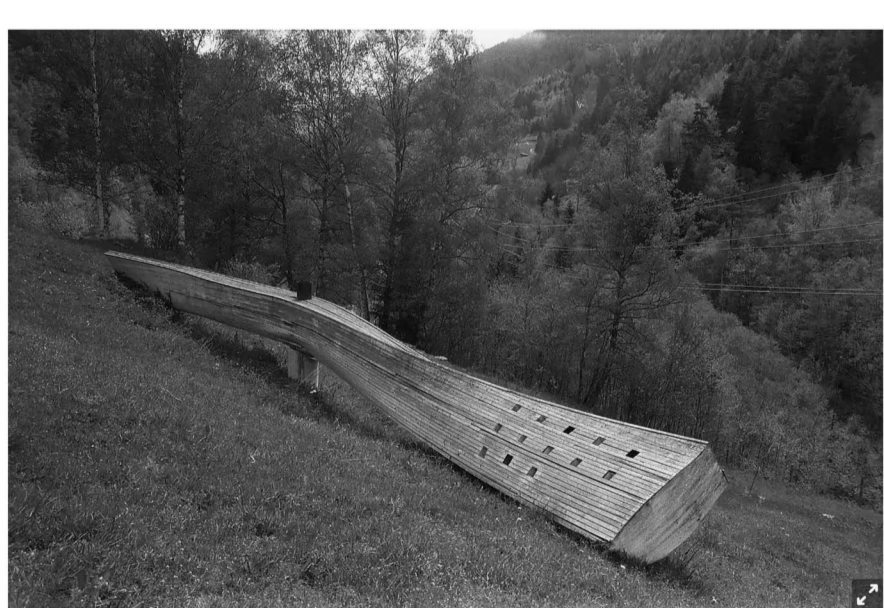
Un élément de l'œuvre «Les grandes barques» posé au cimetière de Vissoie et aujourd'hui disparu. Détruite par le temps, volée ou jetée au rebut

Les artistes apprennent que l'ancien propriétaire a vendu le terrain et que le nouveau n'est pas au courant de cette affaire. La sculpture en métal de 4 mètres de long et 8 mètres de haut de Denis Schneider s'est volatilisée. Les autres aussi. Restent seulement les cinq cubes en métal rouillé d'Alois Dubach, trop lourds pour être délogés. «Si les pièces s'étaient abîmées, si elles avaient été saccagées ou si elles avaient subi une dégradation naturelle, il en resterait des bouts, non? Or, il n'y a plus rien. C'est quand même incroyable. Qu'a-t-il pu se passer? Ont-elles été volées, placées ailleurs, jetées? Mais comment? Par qui?» Autant d'interrogations auxquelles personne n'a, à ce jour, donné de réponses. Le mystère reste entier.